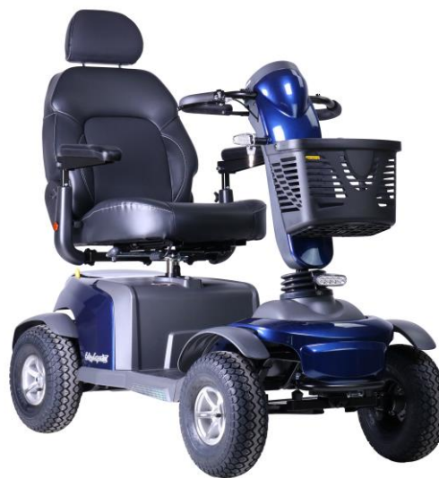
De getoonde productfoto kan afwijken van de standaard configuratie.

Let op: de actieradius is volgens opgave van de fabrikant, gemeten onder ideale omstandigheden met een testgewicht van 75 kg, met aangepaste snelheid van 15 km/u en een temperatuur van 20 graden Celcius in een klinische omgeving. Van invloed kunnen zijn: gebruikersgewicht, weersomstandigheden, snelheid, bandendruk, wegomstandigheden, conditie van de accu's en het wel of niet heuvelachtige landschap.