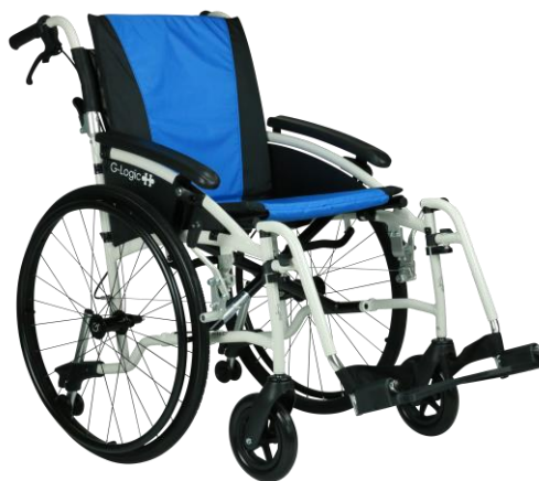
De getoonde productfoto's kunnen afwijken van de standaard configuratie.