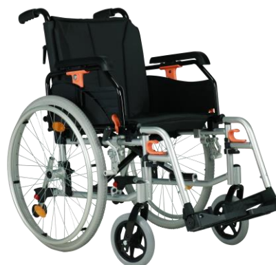
De getoonde productfoto kan afwijken van de standaard configuratie.

Let op: zithoogte 45 cm is uitsluitend mogelijk in combinatie met 6" voorwielen en 22" achterwielen.