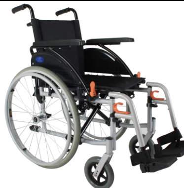
De getoonde productfoto kan afwijken van de standaard configuratie.

* = zitbreedtes 55 cm & 60 cm zijn enkel mogelijk in combinatie met zitdiepte 46 cm.