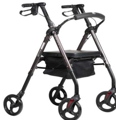
De getoonde productfoto kan afwijken van de standaard configuratie.