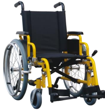
De getoonde productfoto kan afwijken van de standaard configuratie.