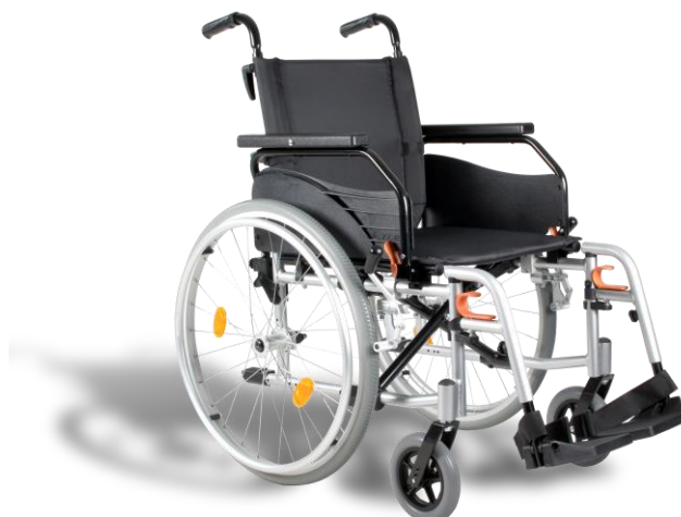
De getoonde productfoto kan afwijken van de standaard configuratie.

* = uitsluitend mogelijk op een zelfvoorbeweger