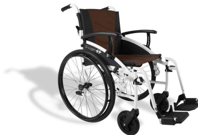
De getoonde productfoto's kunnen afwijken van de standaard configuratie.