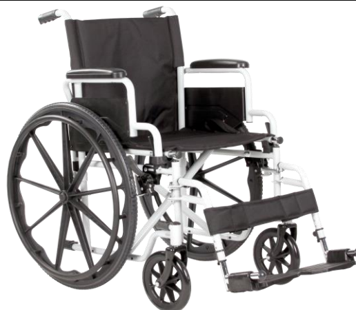
De getoonde productfoto kan afwijken van de standaard configuratie.