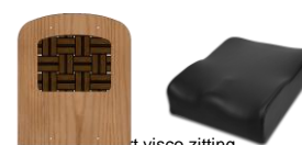
Comfort visco zitting